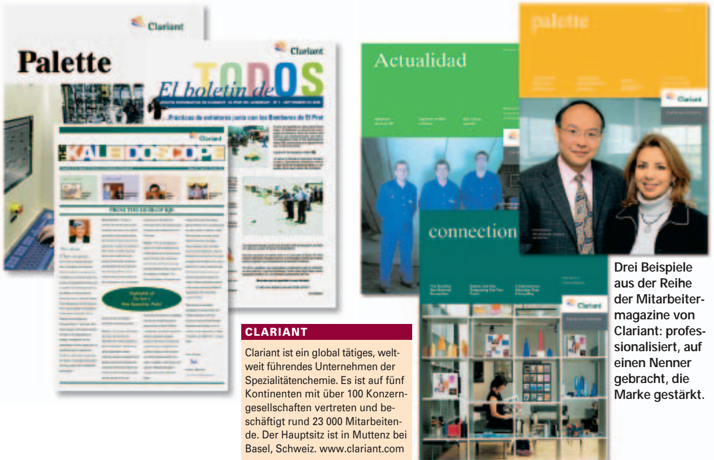
Drei Beispiele aus der Reihe der Mitarbeitermagazine von Clariant: professionalisiert, auf einen Nenner gebracht, die Marke gestärkt.